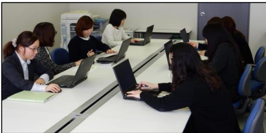
人事事務委託業務